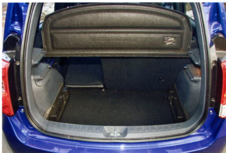
Багажник не очень большой, зато удобной формы и с возможностью увеличения до 1030 л

бы на ней, маленькой, можно было бы припарковаться. Но зачем тогда шумный мотор, резкий отклик на газ и короткоходная подвеска – это скорее не детей возить и не горшки с цветами, а воображать себя драйвером. Но драйверу не понравится «робот», да и высокий «минивэзнийский» кузов он охотно променял бы на низкий, как у купе. Наконец, самый главный вопрос: кого мы хотим победить с начальной ценой в 449 000 рублей за трехдверную машину с мотором 1.1 и конечной в 569 000 рублей за пятидверку с мотором 1.3, «роботом», двумя подушками, полуавтоматическим кондиционером и подогревом сидений? За эти деньги можно найти соперников в похожей комплектации, некоторые окажутся даже комфортнее, найдутся и не менее просторные автомобили. Но, пожалуй, такого набора разных, порой противоречивых, качеств у соперников Colt вы не встретите. И вот поскольку мне трудно представить человека, в котором уживаются столь разные требования к машине, я и не могу опреде-